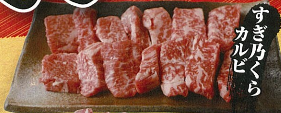
すぎ乃くら カルビ